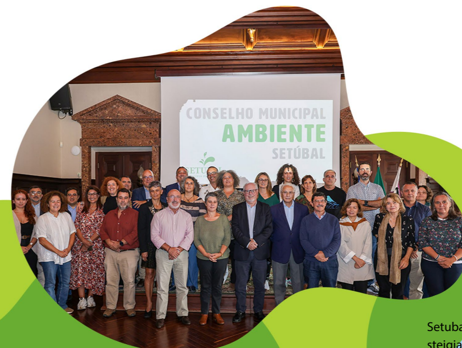
Setubalio savivaldybės aplinkos tarybos (CME) steigiamasis posėdis, 2024 m. rugsėjo mėn

2 lentelėje pateikiamos kitos dalyvavimo veiklos. Pasirinkdami dalyvavimo veiklas turėtumėte vadovautis savo tikslais, kurių siekdami 2, 3 ir 4 etapuose įtrauksite suinteresuotąsias šalis bei gyventojus ir su jais bendrausite.