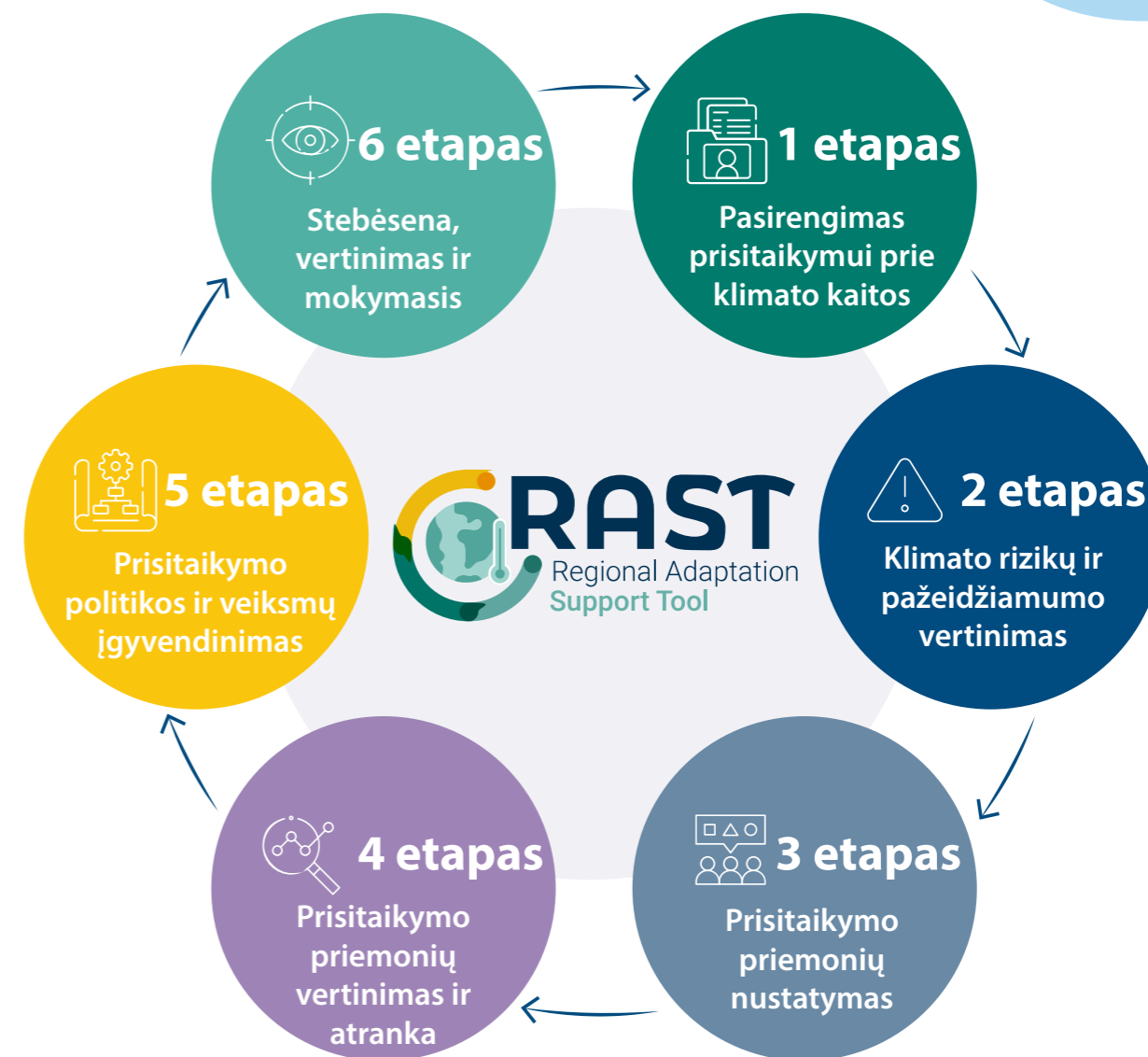
1 pav. Regioninės prisitaikymo paramos priemonės (RAST) etapai.

Vadove siūlomi praktiniai būdai, kaip bendradarbiauti su suinteresuotosiomis šalimis bei gyventojais ir skatinti juos aktyviai dalyvauti visuose prisitaikymo prie klimato kaitos planavimo etapuose. Jame pateikiamos atitinkamos dalyvavimo veiklos gairės ir nurodomos priemonės, geroji patirtis ir pavyzdžiai, kaip įtraukti suinteresuotąsias šalis ir gyventojus į visus prisitaikymo prie klimato kaitos planavimo ciklo etapus, kaip nurodyta Regioninėje prisitaikymo prie klimato kaitos paramos priemonėje (RAST) (1 pav.).